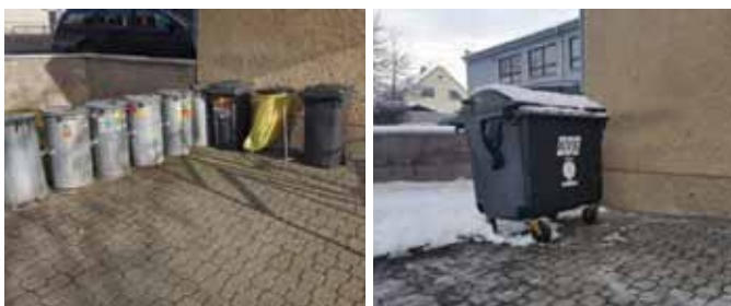
Fotky staré popelnice vedle vchodu u knihovny a nová popelnice.

Doufám, že všichni naši „pejskaři“ budou mít k dispozici dostatek košů, aby uklízeli výkaly po svých čtyřnohých mazlíčcích.