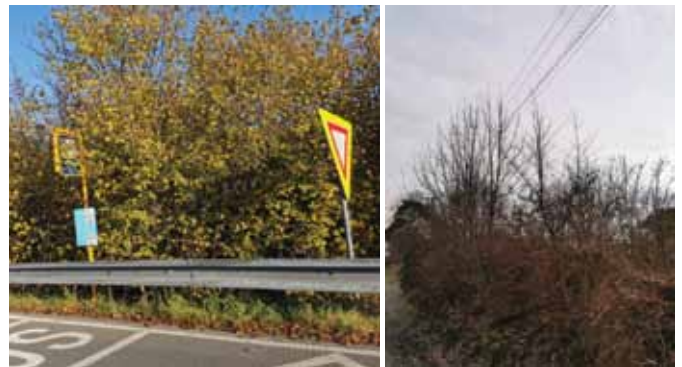
Foto před prořezáním.

Podzimní počasí bylo pro údržbu obce velice příznivé, dalo se tak využít všech dnů k čištění zarostlých chodníků, příkopů, dosekávání trávy a úklid listí. Neopomenuli jsme ani řádnou přípravu našeho hřbitova před Svátkem zesnulých. V okamžiku, kdy začalo období vegetačního klidu, zahájily se práce spojené s prořezem větví místních komunikací.