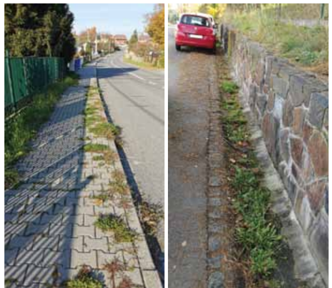
Fotky některých zarostlých chodníků před údržbou...