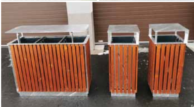
Foto nových košů.